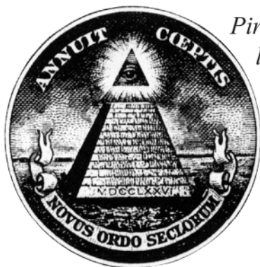
Az egydolláros az USA-ban

Ezeket a jeleket (piramis) Weisshaupttól vették át, amikor 1776. május 1-én megalapították az illuminátusok rendjét. Az illuminátusok és a szabadkőművesek egyesülése, az 1982. wilhelmsbadi kongresszus után, mindkettőnek ismertetőjele lett.